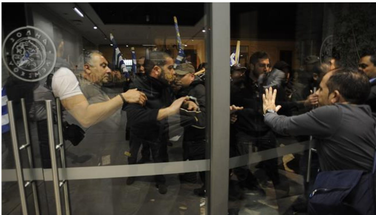
Στιγμιότυπο από την επίθεση του ΕΛΑΜ στη Λεμεσό κατά του Μεχμέτ Αλί Ταλάτ και των παρευρισκόμενων στην ομιλία του, το 2014.